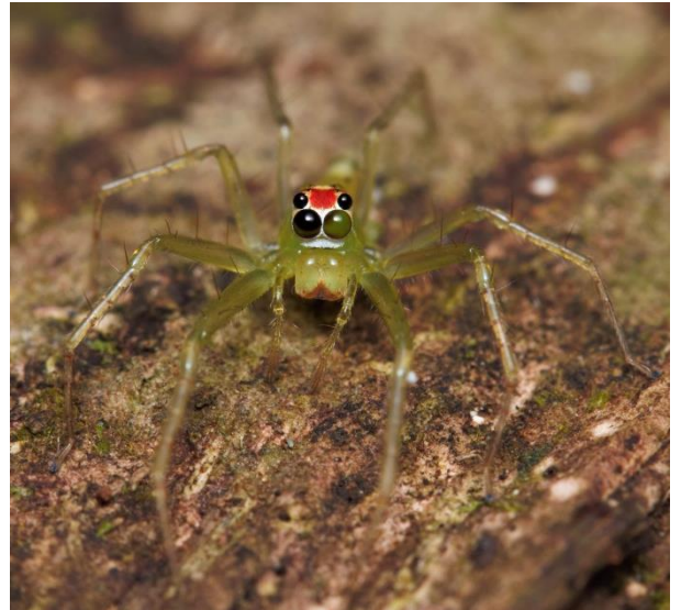
Lyssomanes portoricensis Salticidae.