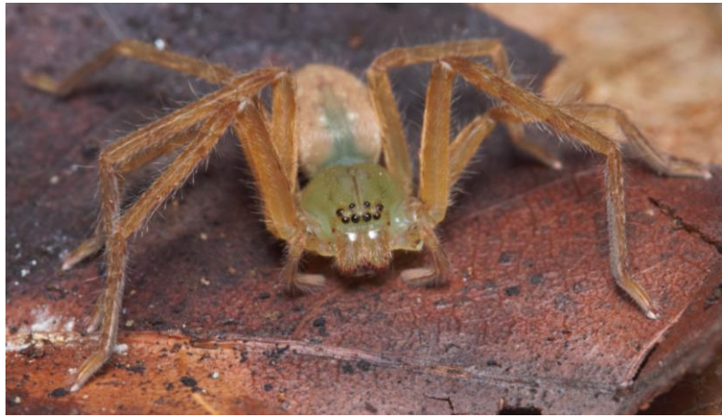
Olios sanctivicensis . Sparassidae. Une des grandes araignées endémique des Petites Antilles.