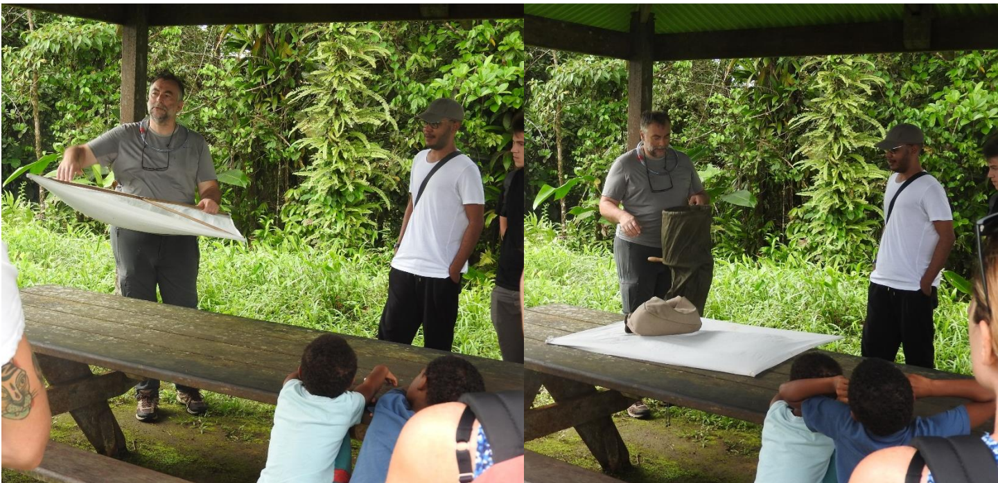
Démonstration de l'utilisation du parapluie japonais(à gauche) et du tamis winkler (à droite).

En Martinique la plupart des araignées sont de petite taille. C'est donc équipés d'un aspirateur à bouche, d'un parapluie japonais et d'un tamis winkler que nous avons débuté la balade.