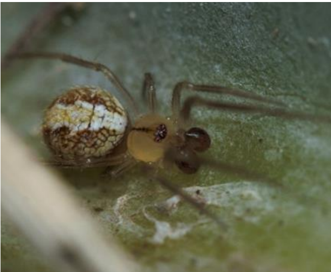
Coleosoma sp. Theridiidae