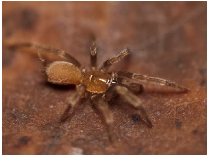
Masteria sabrinae , Dipluridae. Une des petites mygales de Martinique.