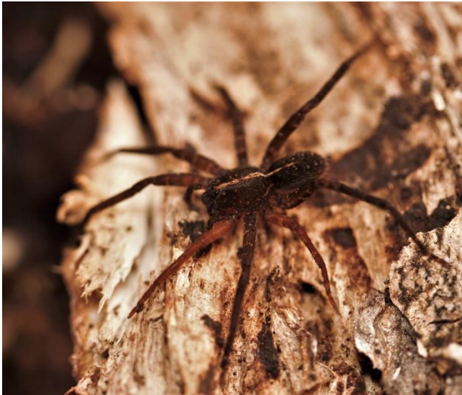
Enoploctenus sp.. Ctenidae