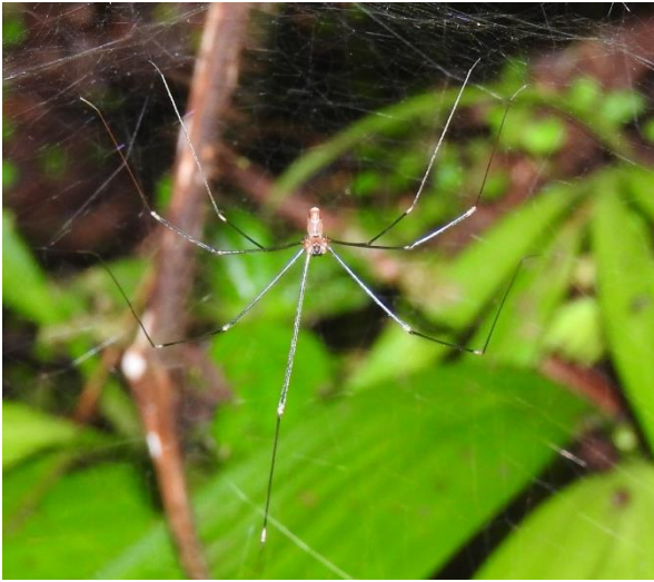
Modisimus cf. glaucus (Simon, 1893), Pholcidae. Espèce connue uniquement des forêts humides des Petites Antilles.