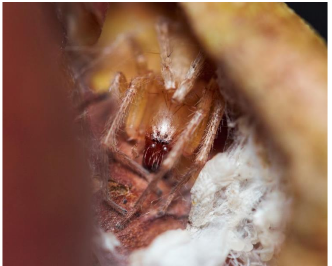
Hibana tenuis . Anyphaenidae.