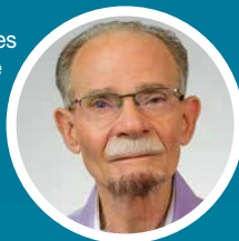
Monsieur Alfred MARIE-JEANNE, Président du Conseil Exécutif de la Collectivité Territoriale de Martinique