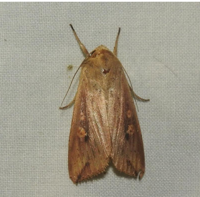
Mythimna sequax (Franclemont, 1951) NOCTUIDAE