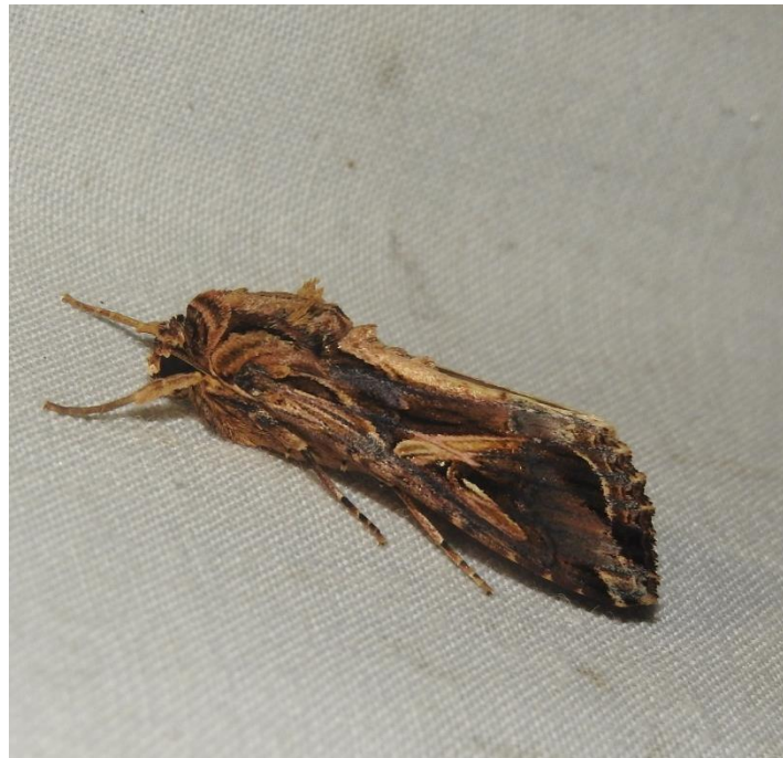
Spodoptera dolichos (Fabricius, 1794) NOCTUIDAE