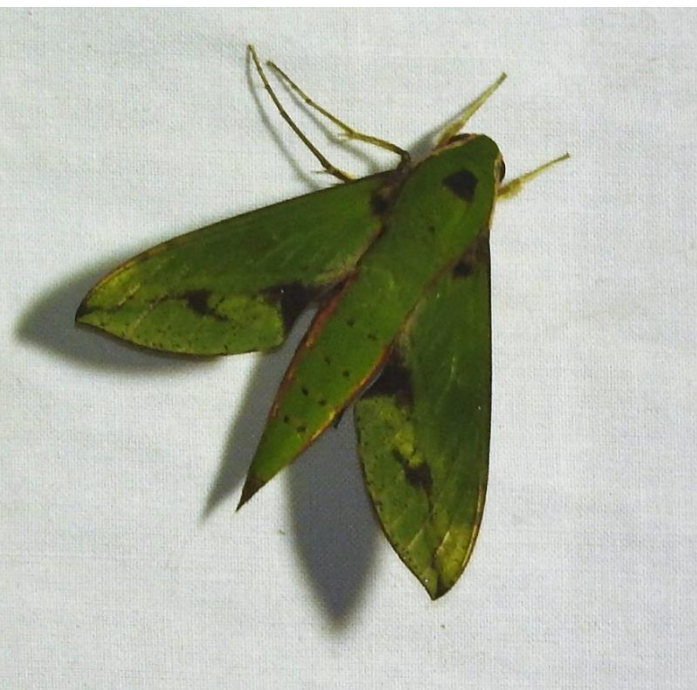
Xylophanes chiron (Drury 1770) SPHINGIDAE