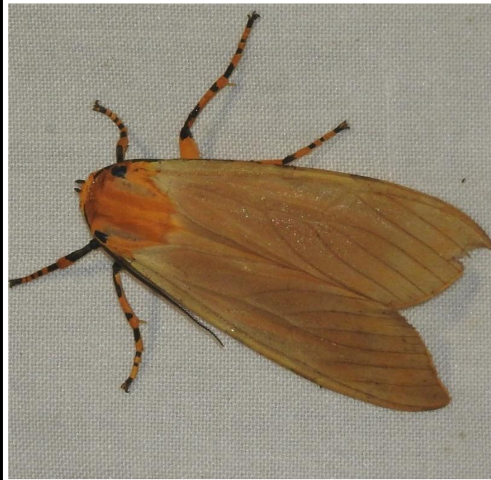
Halysidota leda (Druce, 1890) EREBIDAE