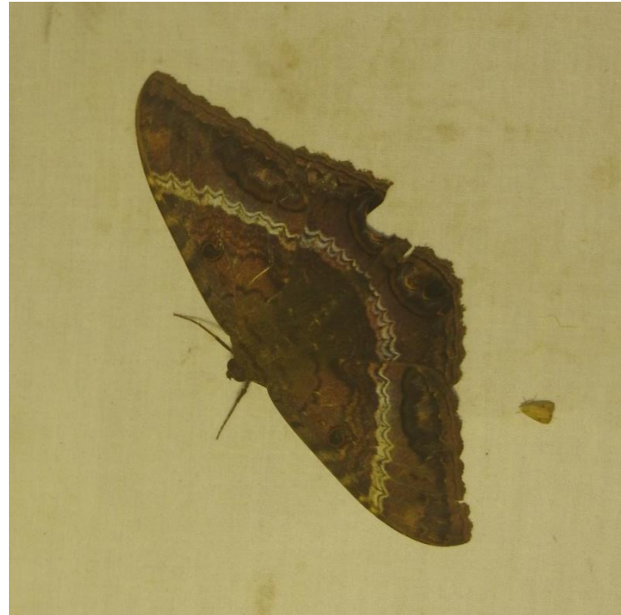
Ascalapha odorata (Linné, 1758) EREBIDAE