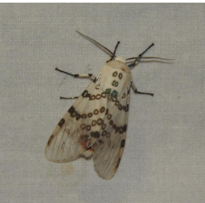
Hypercompe icasia (Cramer, 1777) EREBIDAE