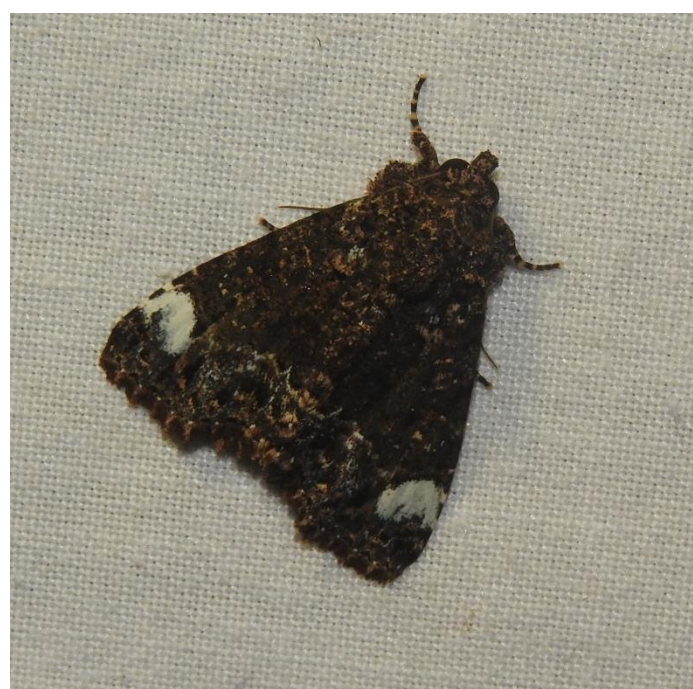
Cropia infusa (Walker, 1858) NOCTUIDAE