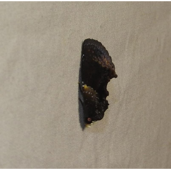
Gonodonta bidens Geyer, 1832 EREBIDAE