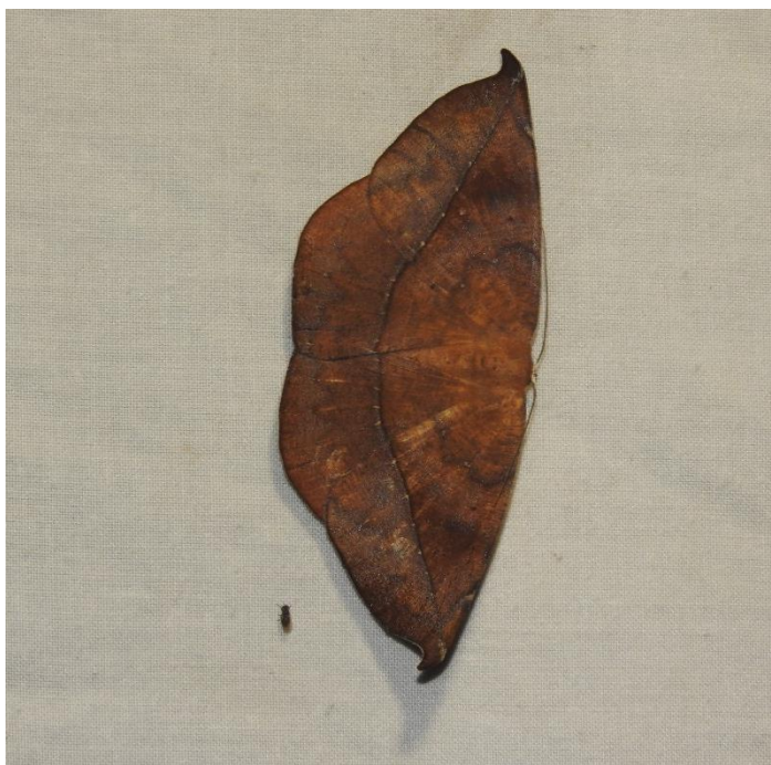
Oxydia brevipecten Herbulot, 1985 GEOMETRIDAE