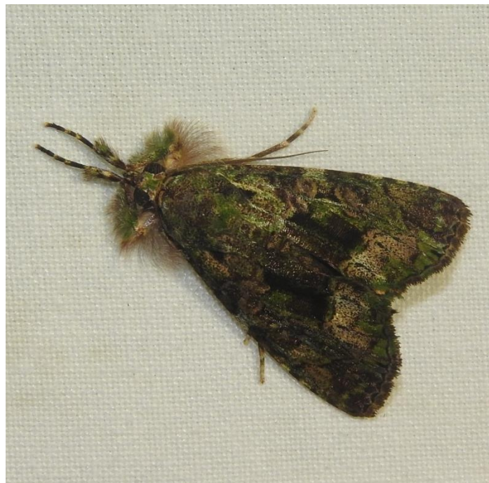
Neophaenis meterythra (Hampson, 1908) NOCTUIDAE