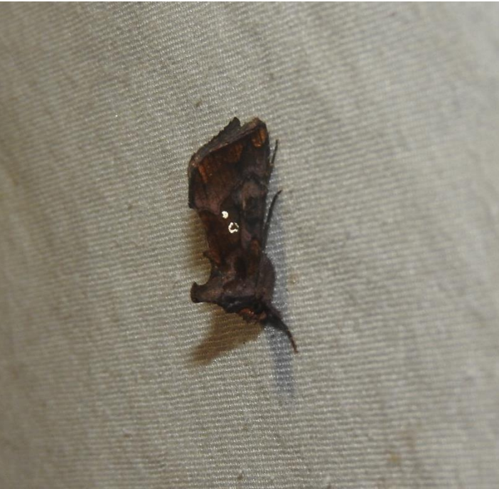
Argyrogramma verruca (Fabricius, 1794) NOCTUIDAE