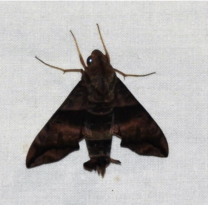
Perigonia lusca (Fabricius, 1777) SPHINGIDAE