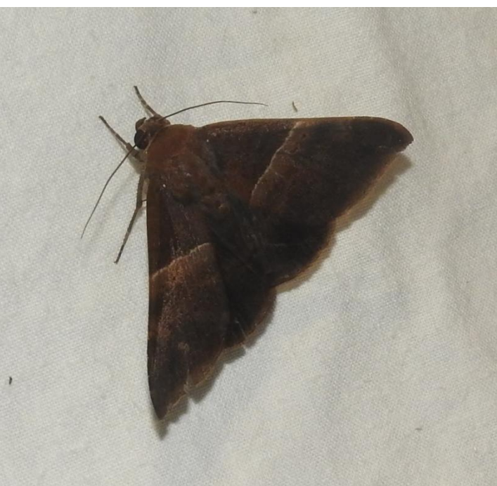
Ophisma tropicalis Guenée, 1852 EREBIDAE