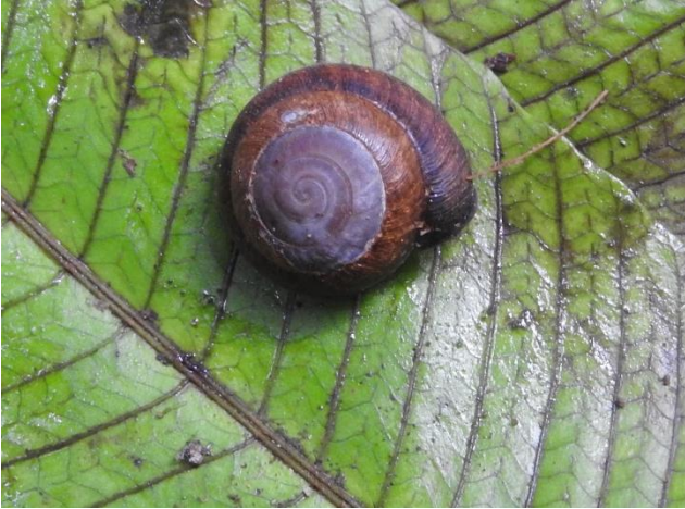
Pleurodonte dentiens (Férussac, 1822) , Pleurodontidae. Espèce endémique des Petites Antilles, plus commune dans les forêts que dans les milieux dégradés.