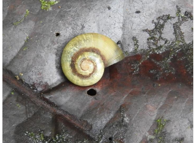
Amphicyclotulus martinicensis (Shuttleworth, 1857), Neocyclotidae. Espèce des forêts humides vivant dans la litière. Espèce rare endémique de Martinique