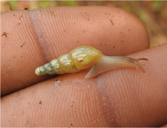
Laevaricella semitarum (L. Pfeiffer, 1842), Oleacinidae. Espèce carnivore prédatrice d'autres escargots.