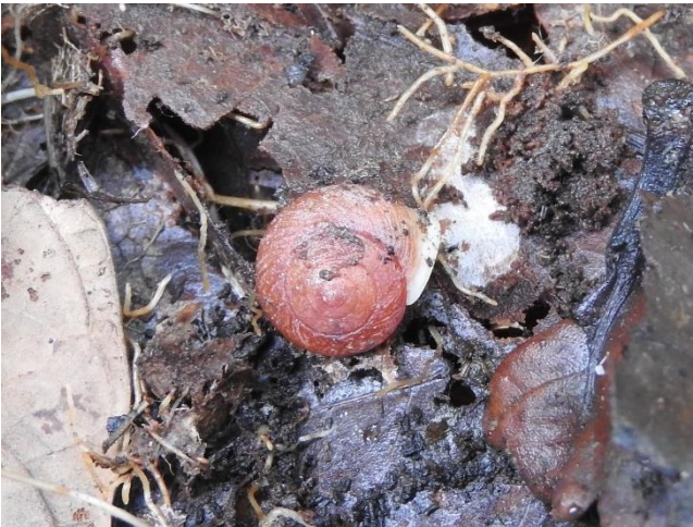
Helicina guadeloupensis Sowerby, 1842, Helicinidae. Espèce vivant dans la litière, se nourrissant de micro algues et de champignons. Endémique des Petites Antilles.