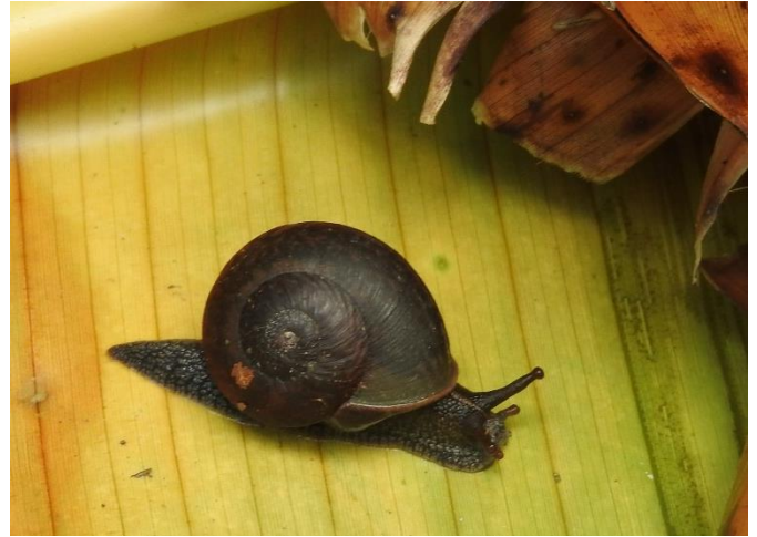
Pleurodonte guadeloupensis roseolabrum (M. Smith, 1911), Pleurodontidae. Endémique des Petites Antilles. Espèce vivant dans la litière.