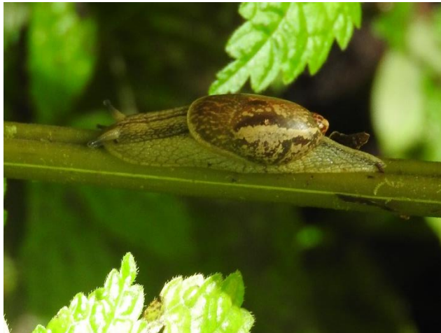
Amphibulima rubescens (Deshayes, 1830), Amphibulimidae. Endémique de Martinique vivant dans les forêts humides.